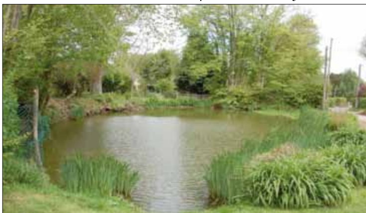
Mare de village - Hameau des Maisonnettes - Le Vaumain