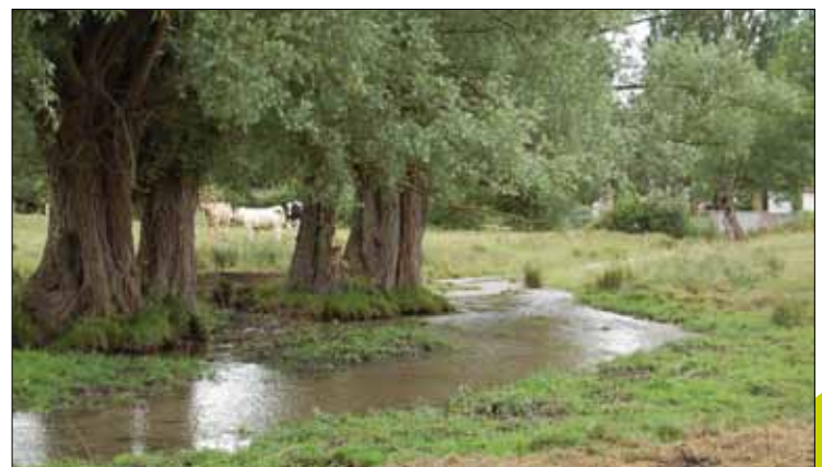
Ru des Martaudes - Ons en Bray