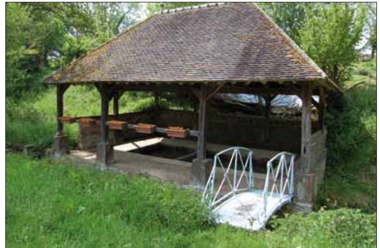
Lavoir - Lhéraule