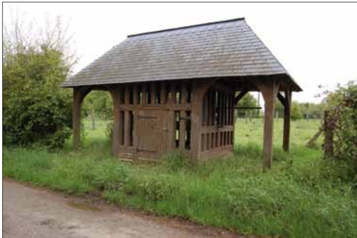
Puits - Hameau de Soumarqué - St Germer de Fly